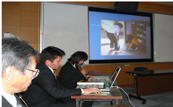
青嶺中学校：取組の紹介