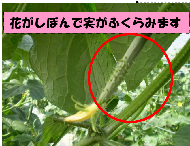
花がしぼんで実がふくらみます