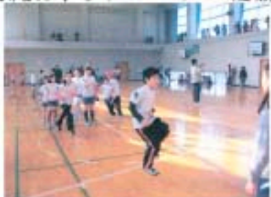
一人ずつ入り、抜けます