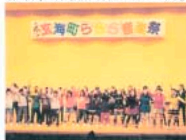
値賀小6年生の合唱