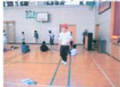
これがデシリットル跳び

4～6年生の個人種目は、「二重跳び」「はやぶさ」「リットル跳び」「デシリットル跳び」に挑戦。長縄は、Fグループの優勝(297回)でした。