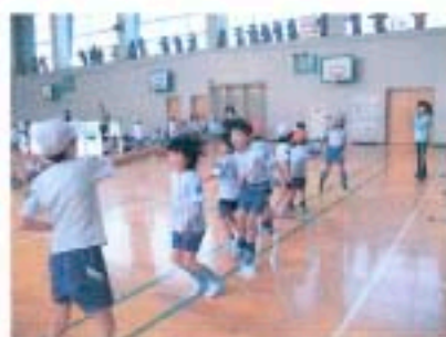
みんなで協力、長縄

4～6年生の個人種目は、「二重跳び」「はやぶさ」「リットル跳び」「デシリットル跳び」に挑戦。長縄は、Fグループの優勝(297回)でした。