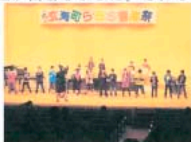
値賀小5年生の合奏