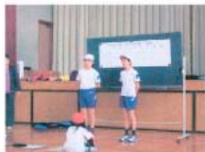
3年生の始めのことば

1～3年生の部では、3年生が始めのことばを言いスタートです。個人種目では、「1だんとび」「かけ足跳び」「あや跳び」「交差とび」などに挑戦しました。長縄跳びでは、6人が一緒に跳び、2分間で何回飛べるかを競いました。優勝はBグループ(150回)でした。