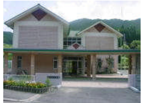
平成24年度学級編制

天川地区は、夏は涼しく過ごしやすい。冬の寒さは厳しく、12月の中下旬より積雪もある。近くにスキー場があり、それにともない道路事情はかなりよくなっている。この地区で収穫する米は「天川コシヒカリ」といわれるブランド米となり、隣県の福岡市の一流料亭が直接契約を結ぶ等大変人気がある。地域の方々は、味・品質ともに自信をもって農作業にあたられている。近頃は巖木・多久・唐津方面へ勤めに出られる家庭も多い。