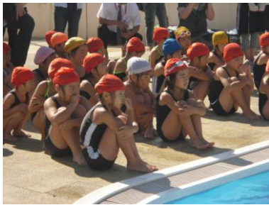
姿勢よく話を聞く1年生

また、水泳大会が終わった後には着衣水泳を行い、服を着たままの泳ぎを体験したり、ペットボトルなどを利用した救命道具の使い方などを学びました。「服を着ていたら、やっぱり泳ぎにつかあー」といって上がってくる子が多くいました。まずは、水難事故にあわないように気がけて生活をして欲しいと思います。