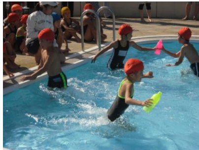
リレーでがんばるよ!