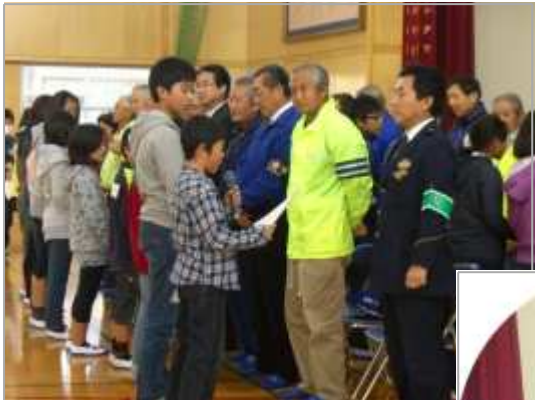
手作りの感謝状を渡しました。

12月13日(火)の全校朝会で、「登下校を見守って頂いている地域の方への感謝の集い」を行いました。昨年度から実施していますが、今年も、