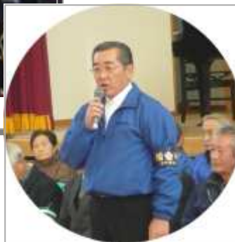
古賀区長さんのあいさつ

12月13日(火)の全校朝会で、「登下校を見守って頂いている地域の方への感謝の集い」を行いました。昨年度から実施していますが、今年も、