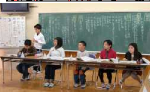
5年生が立派な司会をしました。

1月23日(月)の6校時に代表委員会が行われました。今回の内容は、集会委員会から『3月2日(金)のお別れ集会に向けて、今までお世話になった6年生にありがとうという気持ちを伝え、学校での思い出を作りたい』という提案理由での話し合いになりました。今まで学校をリードしてくれた6年生の運営委員はお手伝いにもわり、5年生の司会により初参加の3年生各クラス2名の代表も加わり、熱心に話し合っていました。5年生は、6年からのバトンを受け継いで立派な司会進行や意見を出していました。お別れ集会が楽しみです。