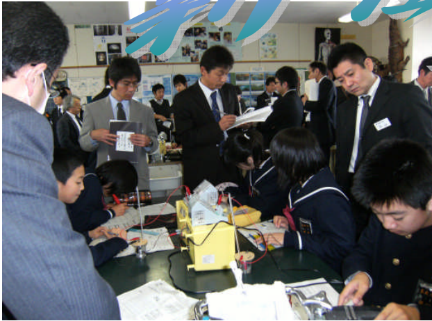
第6学年「理科」公開授業の様子

子どもたちも先生方も日頃の力を精一杯発揮してくれました。参観された多くの方々から、子どもたちのしっかり身に付いた学習態度やPTAの方々からの心温まる対応へのメッセージをいただいています。