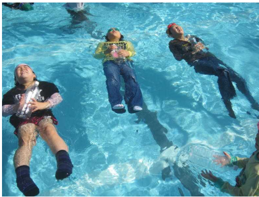
3・4年生の見事な背浮き