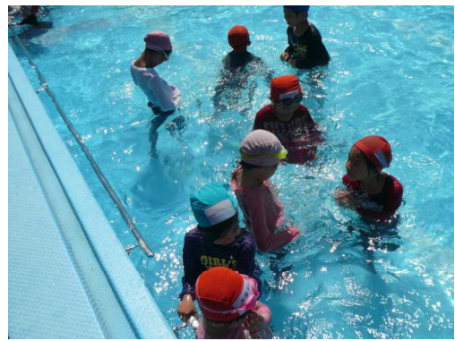
2年生がぬれた服の重さを感じ取っています