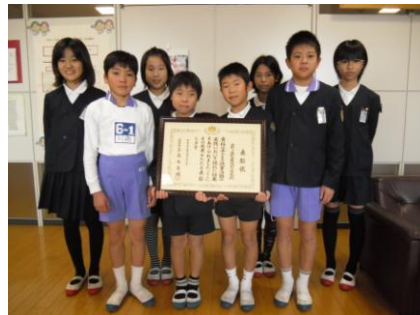
【6年図書委員と賞状】

特に「発表する」ことについては、校内研究の中で学び合いの場の工夫としてとりあげ取り組んできました。1年生の研究授業でも、子ども達は45分間しっかり集中して授業に取り組み、聞くこと・発表することも素晴らしい態度で行いました。この学習で身につけたことを、次の学年でも生かし、伸ばしていきたいように努めたいと思います。