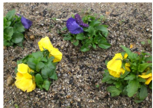
パンジーの周りの耕し

金曜日までは気づかないことだったので、多分土曜日か日曜日に来てくださって手入れをしていただいたのだと思います。直接お礼を言いたいのですが、どなたか分かりません。この書面を借りてお礼申し上げます。有難うございました。お蔭様でパンジーがますます元気よく育っているように見えます。暖かな心を有り難うございます。