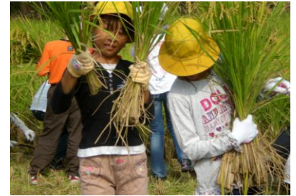
こんなに刈ったよ!!

この米作りの体験活動の締めくくりとして、12月15日(水)に餅つきを行いました。その時には、これまでにお世話していただいた方々を招待し、子ども達から心を込めて感謝の気持ちを述べてもらいました。地域の方々、本当にありがとうございました。