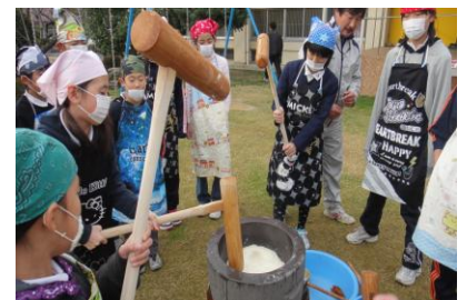
芝生広場で餅つき